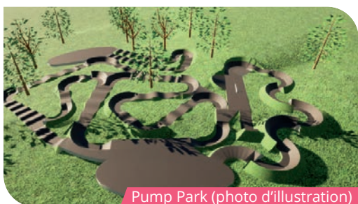
Pump Park (photo d'illustration)