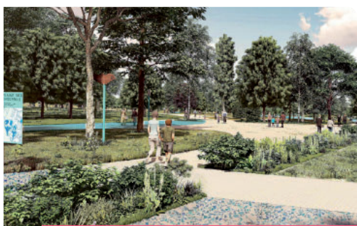
Liaisons pédagogiques (photo d'illustration)